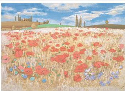
Tosukana no Mugibatake (Wheat Field in Tuscany)

A ce moment-là, il y avait une exposition rétrospective d'une peintre japonaise Fumiko HORI, décédée début 2019 à plus de 100 ans. Rien à voir avec les estampes....mais une jolie découverte de toute une vie.